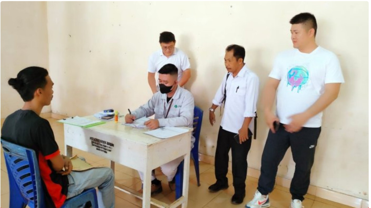
Tampak salah satu calon tenaga kerja PT GNI sedang proses rekrutmen di Desa Towara

TOWARA, Morut Sulteng- PT Gunbuster Nickel Industry (GNI) kembali menggelar Job Fair atau perekrutan secara langsung tenaga kerja lokal di Desa Towara, Kecamatan Petasia Timur, Kabupaten Morowali Utara, Propinsi Sulawesi Tengah, Kamis (23/03/2023).