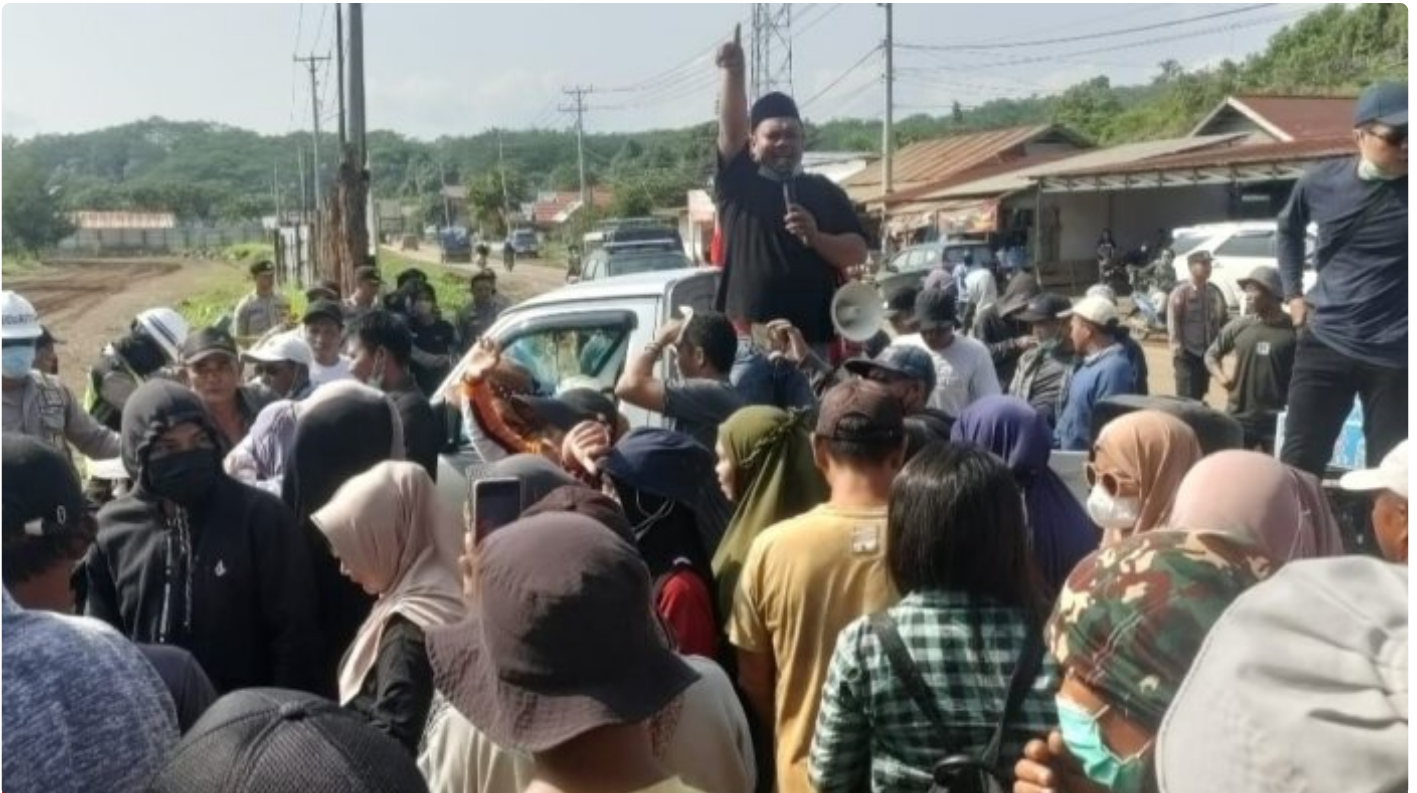
Tampak Korlap Aksi Demo Menyampaikan Orasinya di depan Kantor AFB Desa Lalampu

MOROWALI, Sulawesi Tengah- Tuntutan Aksi Demo yang dilakukan sejumlah warga Desa Lalampu masih menunggu keputusan dari PT Ang and Fang Brother (AFB) perusahaan tambang yang berlokasi di desa tersebut.